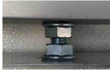
COLGADOR EN RANURA DE TROLLEY CON TUERCAS DE FIJACIÓN Y AJUSTE