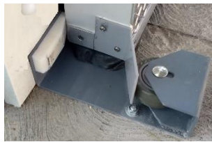
BASE CON RUEDA DE EMPUJE PREUBICADA CON ANGULO DE CIERRE Y PROTECTOR DE EMPAQUE