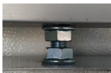
COLGADOR EN RANURA DE TROLLEY CON TUERCAS DE FIJACIÓN Y AJUSTE