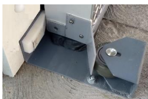
BASE CON RUEDADE EMPUJE PREUBICADA CON ANGULO DE CIERRE Y PROTECTOR DE EMPAQUE