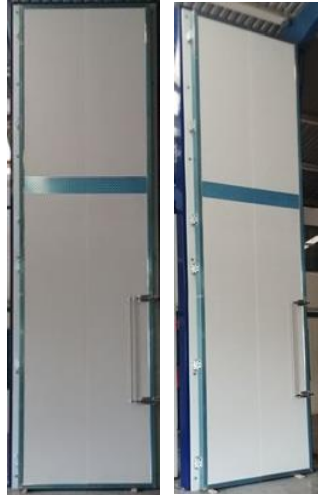
CERROJO DE DOS PUNTOS

SEPT-2020 - IMÁGENES DE PUERTA SENTIDO IZQUIERDO 1.56 x 5.78 MTS.