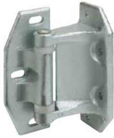
ITEM # 998