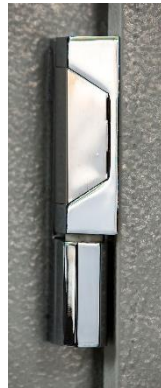
BISAGRA DE CANTO