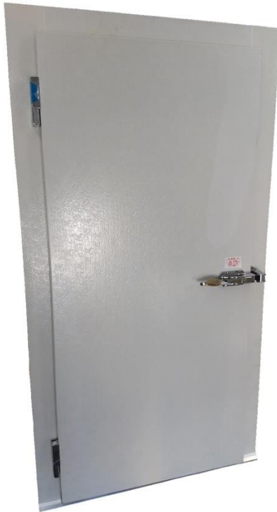
SEPT-2020 IMAGEN DE PUERTA ABATIBLE MODELO "E"