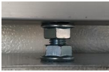
COLGADOR EN RANURA DE TROLLEY CON TUERCAS DE FIJACIÓN Y AJUSTE