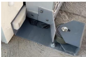
BASE CON RUEDADE EMPUJE PREUBICADA CON ANGULO DE CIERRE Y PROTECTOR DE EMPAQUE